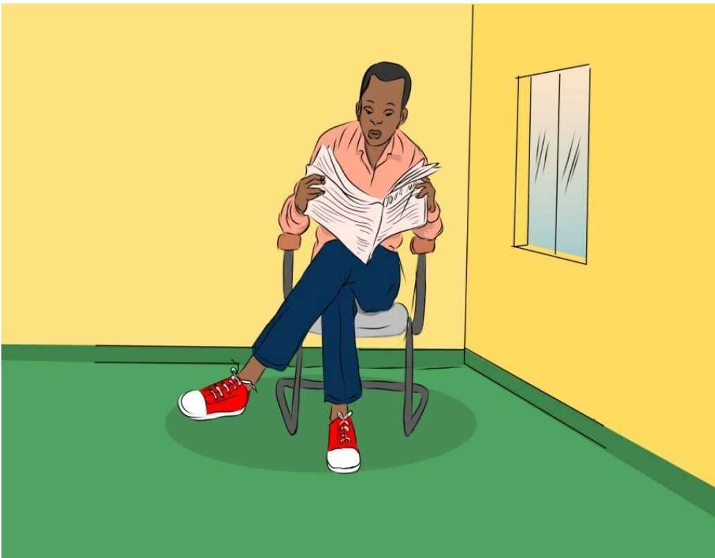
Image: Le personnage qui lit le journal doit être une fille